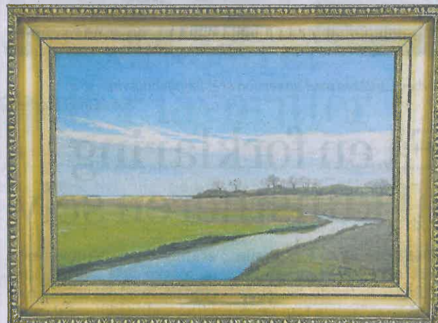
Et karakteristisk landskab af L.A. Ring. Her fra hans sydsjællandske fødeegn.