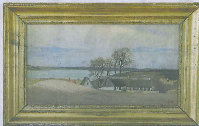
Typisk sjællandsk Ring-motiv.