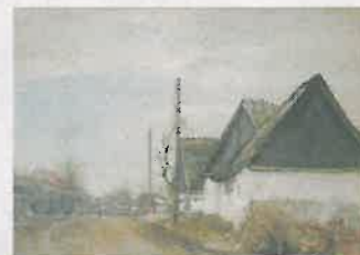
Hjørnet af Smedegade og Toftegade.

weg Ovesen konstaterer, at Rings billeder ofte er malet i dæmpede farver, men at han inden for den begrænsede farveskala opnår store, koloristiske kvaliteter.