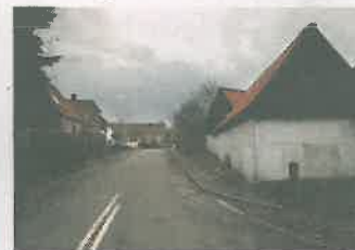
Sådan ser der ud på samme sted i dag.