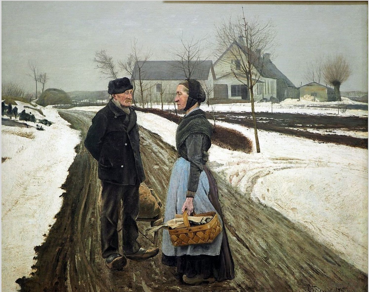
Et lille hvil, 1908