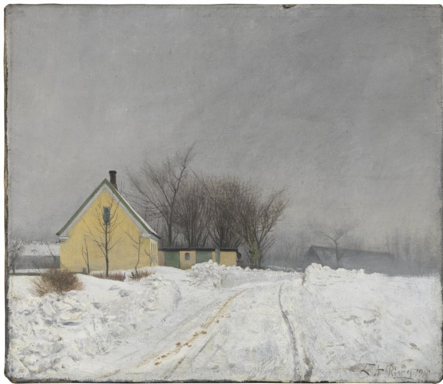
Tåget vinterdag , 1910, 39 x 45. Købt 2016