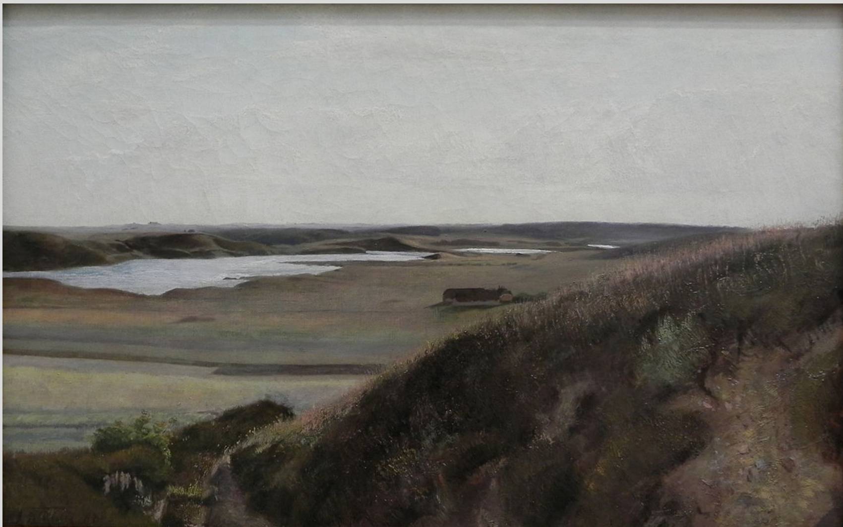
Jysk hedelandskab. Motiv fra Bryrup, 1888