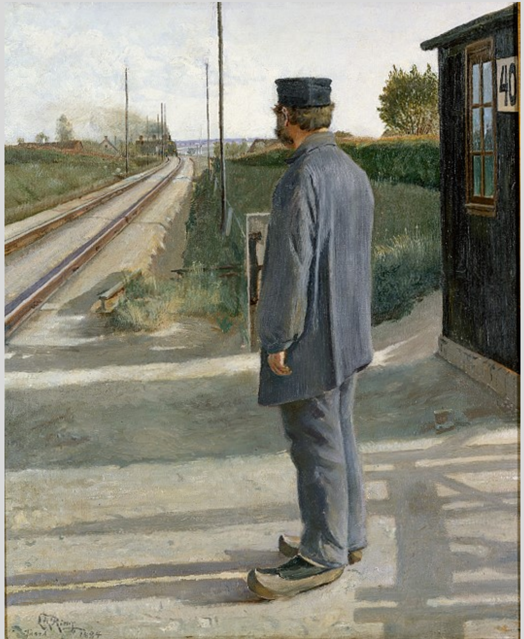
Banetrovanden. Landsbyen Ring, 1884, 57 x 46. Købt 1951.