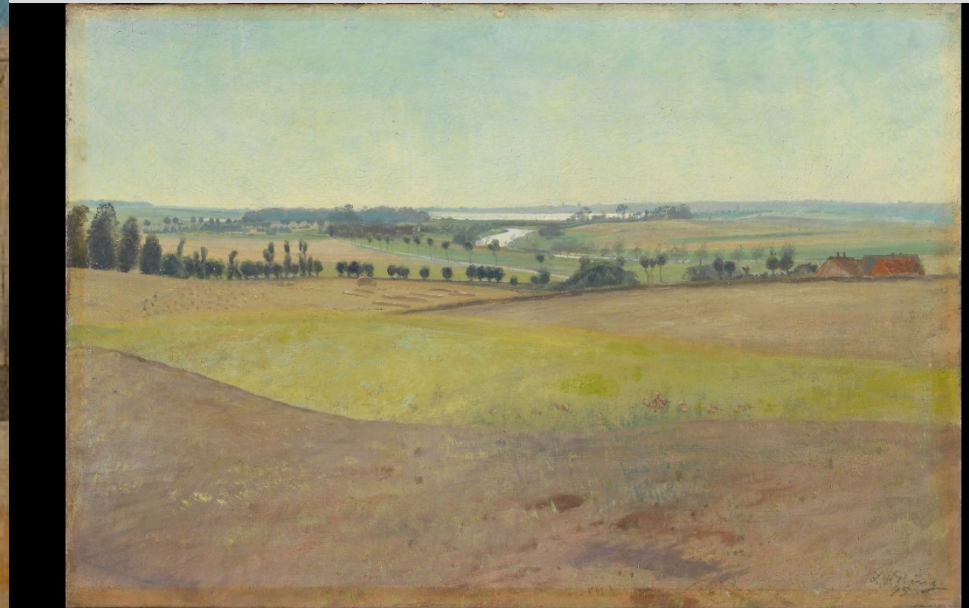
Dansk sommerlandskab, 1895, 46 x 68,5. Købt 1997