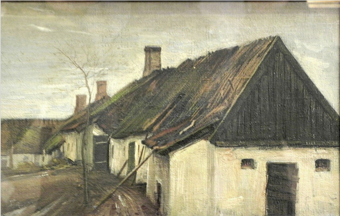
Huse i Hersted, 1890