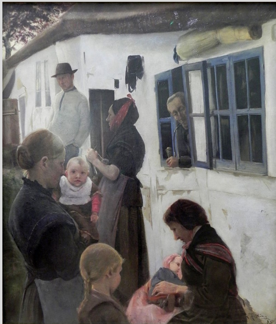
Folk foran deres hus, 1885 HCC 47: Efter Fyraften.

Ring-samlingen blev indkøbt over perioden 1988-2010 på Bruun Rasmussens Kunstauktioner.