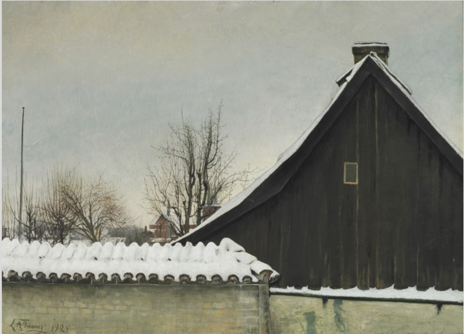
Vinterdag ved Sankt Jørgensbjerg Kirke, 1925, 58 x 79 Currier Museum of Art, Manchester, New Hampshire, købt 2019