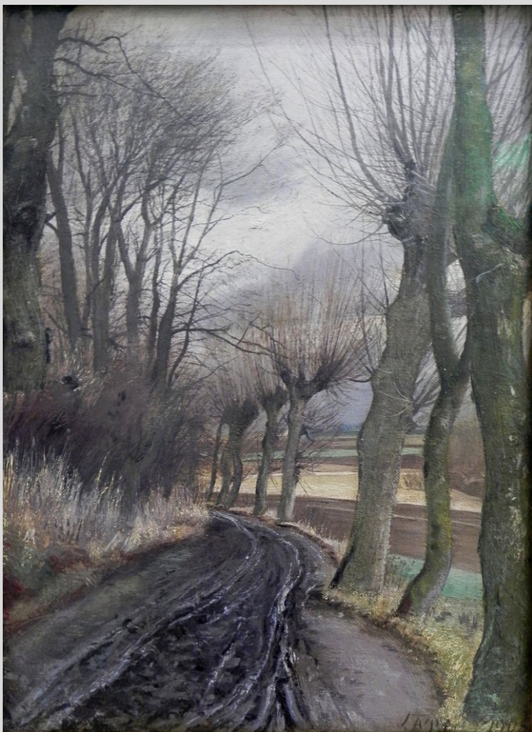
Vejen til Høje Taastrup, 1908