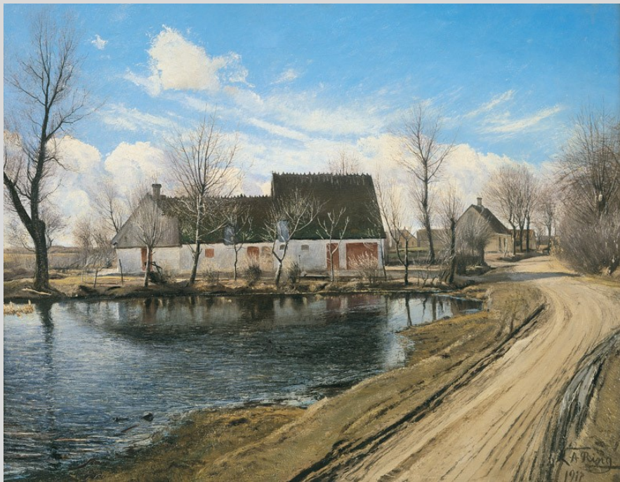
Vej ved gadekæret i Baldersbrønde, 1913, 64 x 110