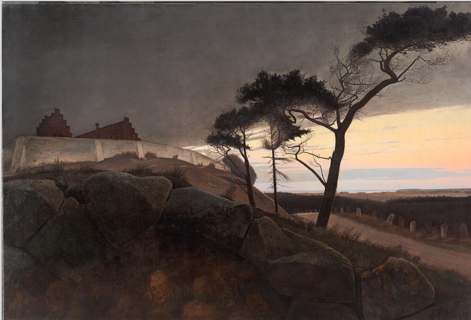
Efter solnedgang, "Nu skrider Dagen under og Natten vælder ud", 1899. SMK