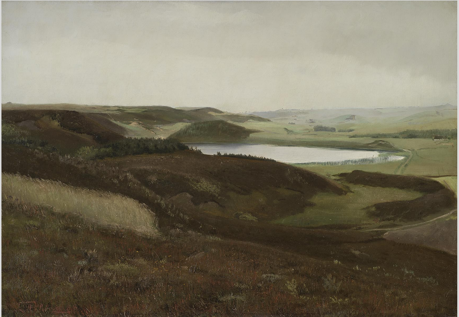
Landskab fra Bryrupegnen, 1888, SMK