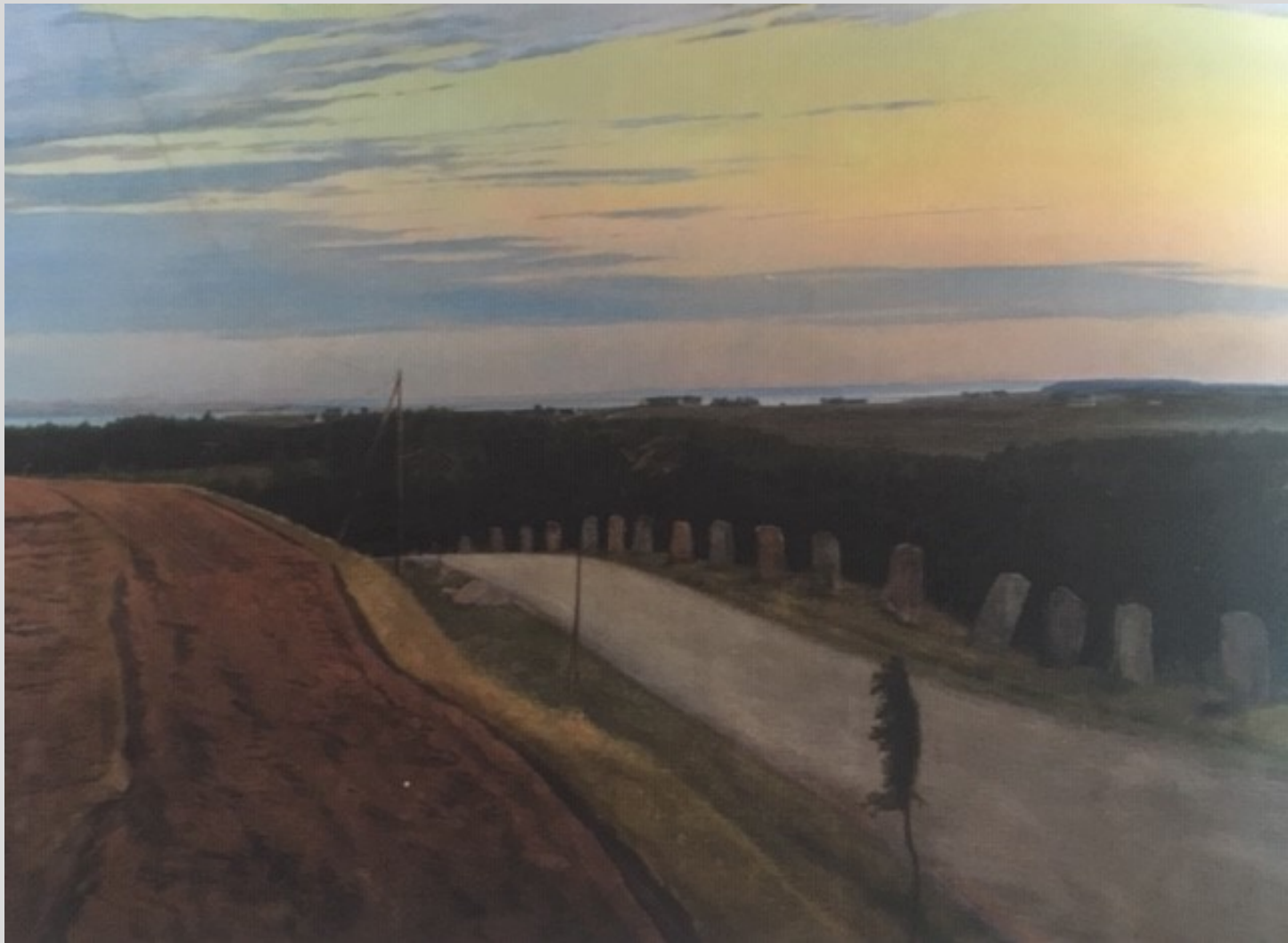
Aften. Landevej mellem Helsingør og Frederiksværk, 1899. 108 x 142.