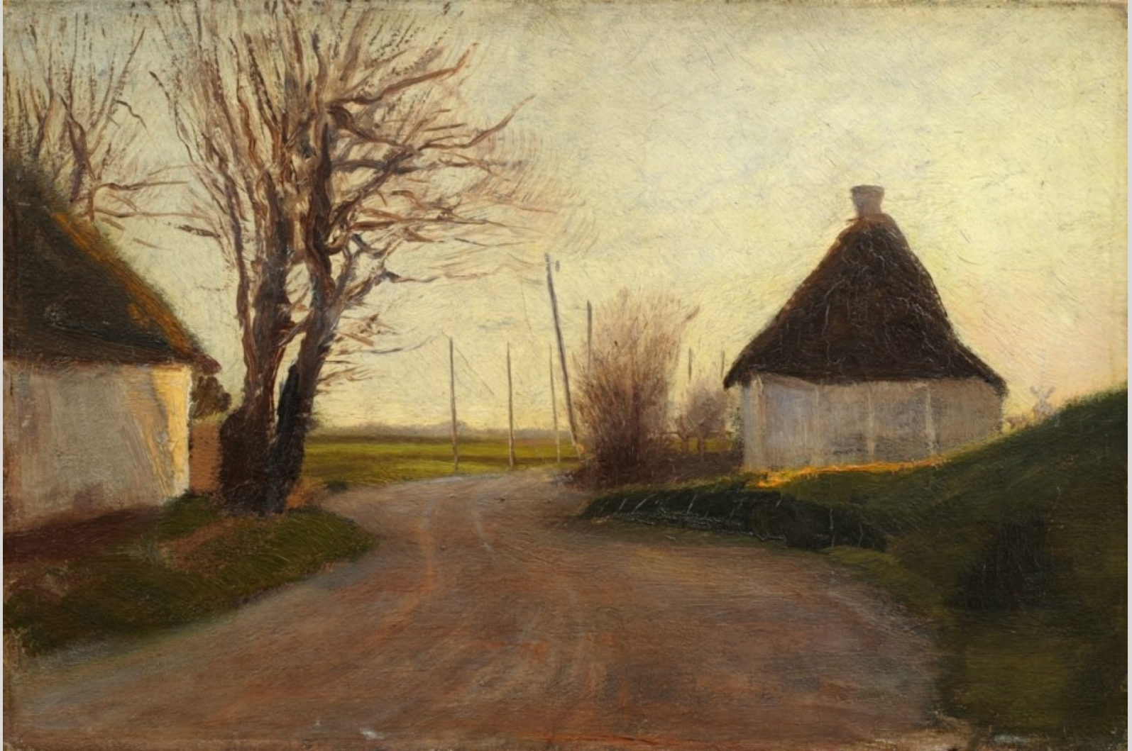
Landskab , før 1902, 22 x 33. Gave fra Pontus Fürstenberg 1902