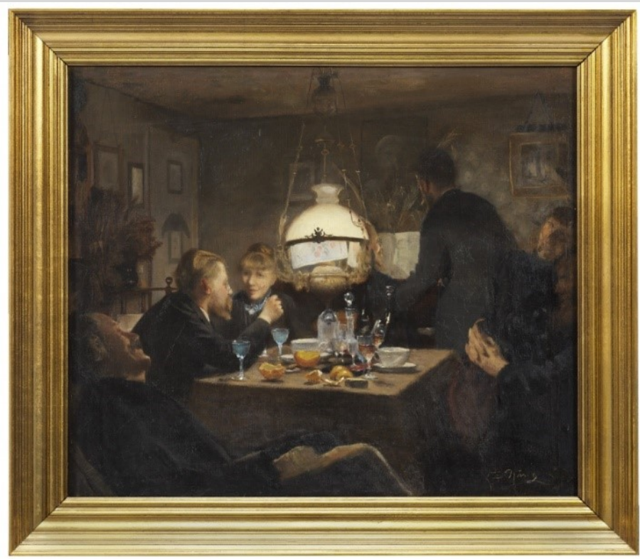
Aftenselskab , 1886(8), 45 x 52. Købt 2016