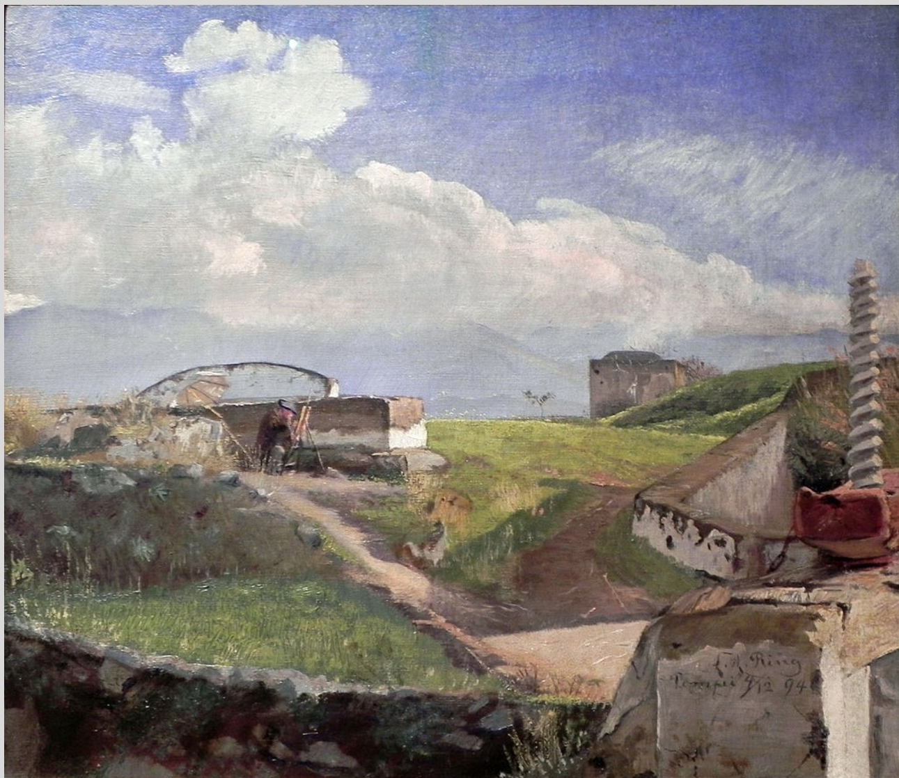
Sluse ved Pompeij. En friluftsmaler med parasol, 1894