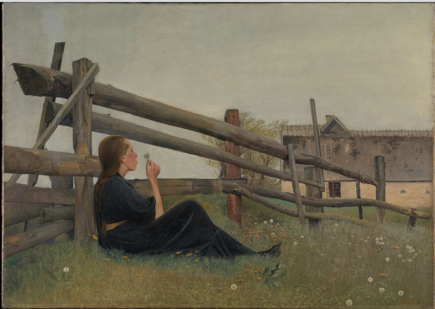
I juni måned, 1899, 88 x 124. Købt 1984