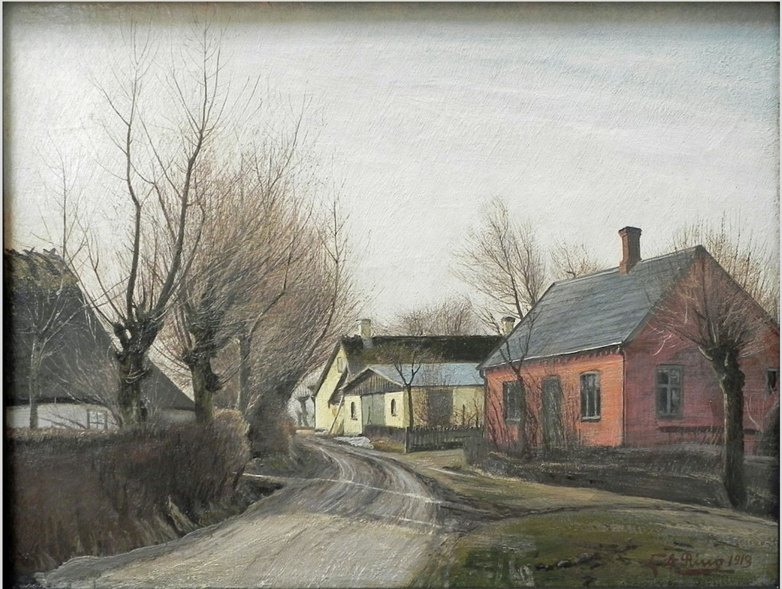
Vej i Baldersbrønde, 1913