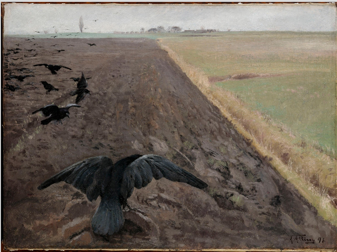
Krager på pløjemarken. Næstved, 1891

56 x 76 cm. Toledo Museum of Art, købt 2016, 1. erhvervelse til museum i USA